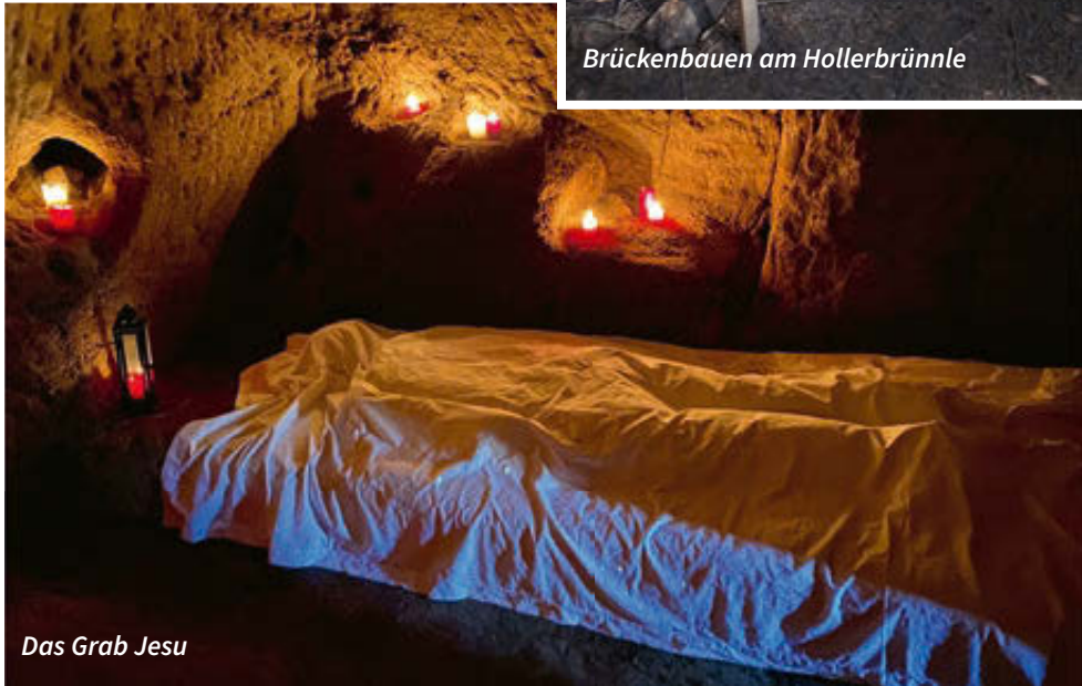
Das Grab Jesu