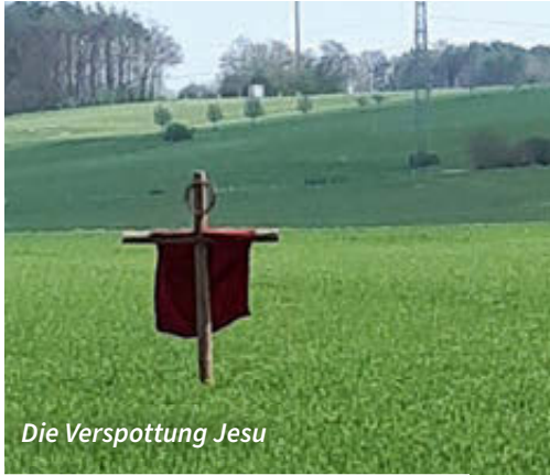
Die Verspottung Jesu