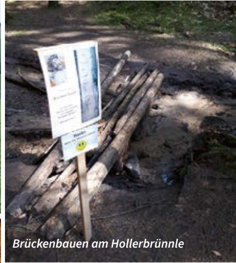
Brückenbauen am Hollerbrünnle